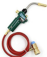
Schweißbrenner (ohne Gas)