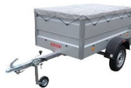
kl. Hänger ohne Bremse kl. Hänger mit Bremse