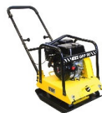
Rüttelplatte 130kg / 60kg