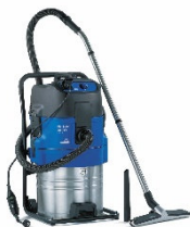
Staubsauger für Wasser