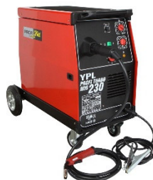
Schweißgerät Schutzgas 380V (ohne Gas)