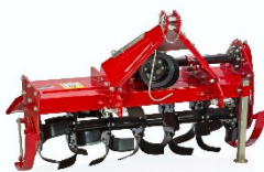
Ackerfräße für kl. Traktor