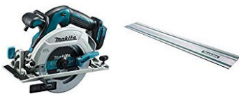
Handkreissäge groß und klein