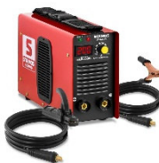
Schweißgerät Elektroden 380V