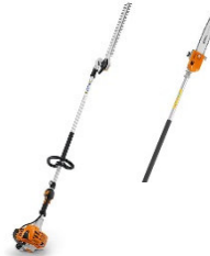
Heckenschere + Motorsäge mit langem Stiel